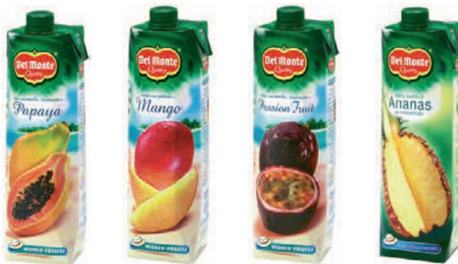
Le bevande Del Monte rappresentano un'altra linea di spicco.

Del Monte Foods Italia spa Sede Amministrativa Via Noto, 10 20141 Milano Tel. 02.5746071 Fax 02.56802484 www.freshdelmonte.com www.anaschesorpresa.it www.follettidelmonte.it Stabilimento Via Perossaro, 10 41038 San Felice Sul Panaro (Mo)