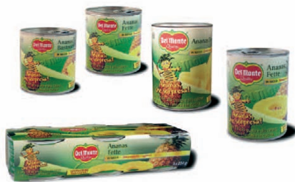
La gamma dell'Ananas in succo in scatola, core business della società.

dipendenti e un fatturato 2004 di 2,9 miliardi di dollari (+16% sul 2003), la società opera nel nostro Paese attraverso il distributore Simba Italia.